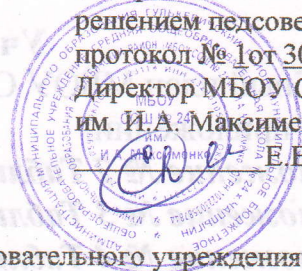
Таблица-сетка часов учебного плана муниципального бюджетного общеобразовательного учреждения средней общеобразовательной школы № 24 х. Чаплыгин муниципального образования Гулькевичский район имени Героя Советского Союза И.А. Максименко для V класса 2024 – 2025 учебный год