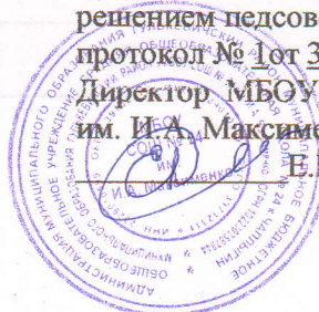
Таблица-сетка часов учебного плана муниципального бюджетного общеобразовательного учреждения средней общеобразовательной школы № 24 х. Чаплыгин муниципального образования Гулькевичский район имени Героя Советского Союза И.А. Максименко для I класса 2024 – 2025 учебный год